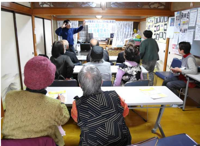
みなさんの関心のあるテーマで開催。